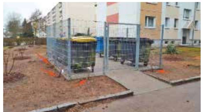
Bildbeispiel Slubicer Str. 1 : Hier wurde der Standplatz bereits im letzten Herbst fertiggestellt. Und genauso werden die Müllplätze auch an der Erich-Weinert-Straße 38 – 56 gestaltet. Die roten Pfeile zeigen die Knöterich-Pflanzen die den Stellplatz später grün einhüllen werden.