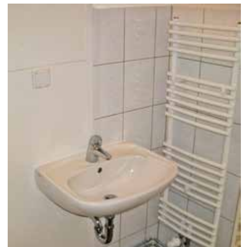
... und neben dem ebenfalls neuen Waschbecken gibt es einen Handtuchhalter-Heizkörper, der morgens das Frotteetuch mollig vorgewärmt bereithält.