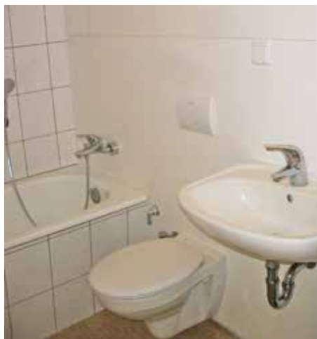
Alles kompakt vorhanden: Neue Einbau-Badewanne mit modernen Armaturen, separater Waschmaschinenanschluss, neues Vorwand-WC ...

tungsdetails sollen auch in den Häusern Am Stadion 4 – 11 zum Standard werden. Baustart für die Nummern 8 – 11 ist im März. Im Mai folgen 4 – 7. Die zwischen der SEWOBA, dem Planungsbüro und den Handwerkern eingespielte Baustellenorganisation wird dafür sorgen, dass die Bäder jeweils nicht länger als eine Arbeitswoche Baustelle sind.