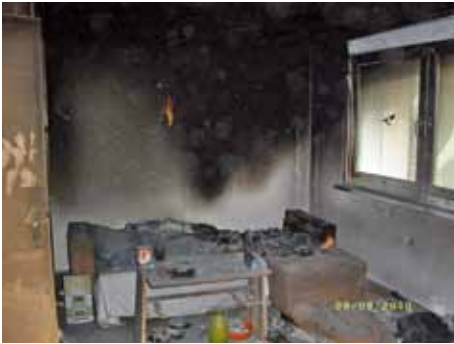
Wohnung am Stadion in Seelow

Die Abarbeitung bis zum letzten Versicherungsschreiben kann jetzt, für die am 06.09.2010 durch einen Brand unbewohnbar gewordener Wohnung Am Stadion 11 in Seelow, gemeldet werden.