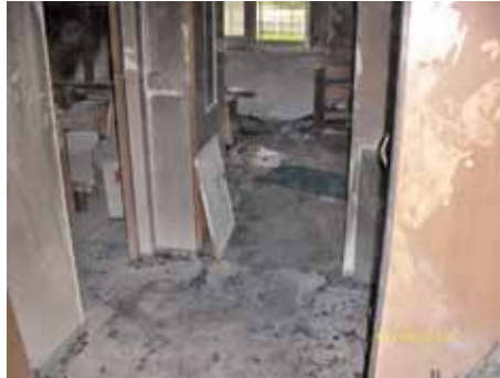
Wohnung am Stadion in Seelow

Die Fertigstellung der Sanierung von einer Brand geschädigten Wohnung ist abgeschlossen. Die betroffene und jetzt komplett sanierte Wohnung stand ab den 06.12.2010 wieder dem Wohnungsmarkt zur Verfügung. Die Wohnung ist schon wieder vermietet, die massive Sanierung zieht auch einen bürokratischen Aufwand mit sich. Aber jetzt konnten die letzten Abstimmungen mit dem Versicherer getroffen werden und die Akte zur Schadensabwicklung geschlossen werden. Der Umfang eines solchen Schadenereignisses geht von der Unterbringung des Geschädigten, über die Brandschuttbeseitigung, Gutachten, Planung und Koordination der Sanierung bis hin zur Abrechnung der verbrauchten Energie für die Handwerker.