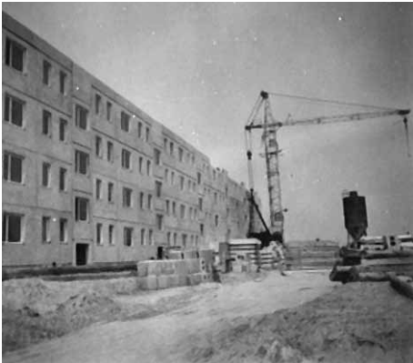
Slubicer Straße 1-15 in Seelow bei der Erbauung im Jahr 1965

Wir haben von einer langjährigen Mieterin ein altes Foto erhalten, auf dem ihr Wohnblock, errichtet im Jahr 1965, zu sehen ist.