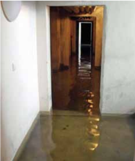
im Keller Hoher Weg 3a in Alt Tucheband

Der Artikel in unserer letzten Ausgabe der Mieterzeitung hat doch viele Bürger und Bürgerinnen berührt. Heute möchten wir noch einmal über die Umstände berichten, mit denen unsere Mieter täglich umgehen müssen.