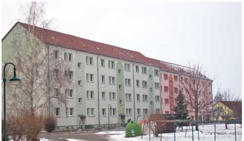
Friedensstraße in Manschnow

Vielleicht für den ersten Start, 2-Raumwohnung in Manschnow, Friedensstraße 70f, 2. Obergeschoss 2 Zimmer, Küche, Bad, Keller; unrenoviert, dafür kautionsfrei, 49 qm Wohnfläche, KM 200 €/ NK 110 €