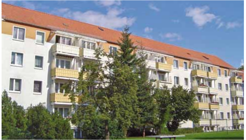
Weidenweg in Seelow

3-Raumwohnung in zentraler Lage, in Seelow, Am Rathaus 12, 3. Obergeschoss 60 qm, modern gefliestes Wannenbad, Küche, Keller, Parkplatz vor dem Haus, unrenoviert, dafür kautionsfrei, KM 268 €/ NK 132 €