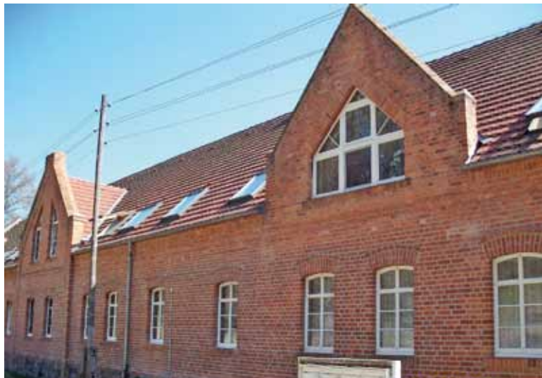
Whudenerweg in Reitwein

Schöne vollmodernisierte Dachgeschosswohnung in Reitwein, Wuhdener Weg 15, 2 Zimmer, modern gefliestes Wannenbad, Küche, Keller, Parkplatz hinter dem Haus, vollständig renoviert, Teppichboden in den Wohnräumen, 62 qm Wohnfläche, KM 261 €/NK 124 € Kautions- 2 Nettokaltmieten