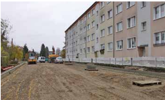
Straßenbau im Weidenweg

ert. Seit Jahren wurden die Zustände in diesem Wohngebiet durch die Bewohner angemahnt, doch bisher fehlte das Geld. Die SEWOBA investiert jetzt rund 300.000€ in das Projekt. Die SEWOBA GmbH vergab die Planungsleistung an das in Seelow ansässige Ingenieurbüro Friedrich.