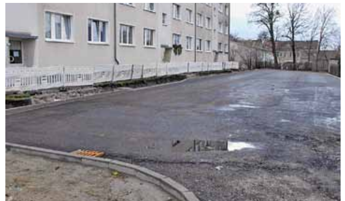
Straßenbau, Einbau Asphalttragschicht